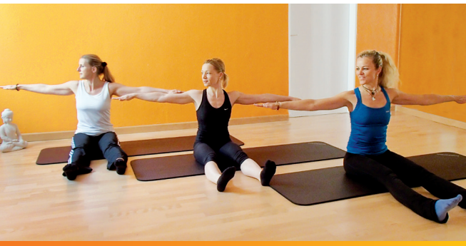
Persönlicher geht's nicht! Unsere Ausbildung findet in Kleingruppen ab 3 Teilnehmern statt.

Ein guter Pilates Unterricht setzt ein gewisses Maß an Übung voraus. Deshalb müssen zwischen den Modulen Unterrichts-, Hospitations- und Trainingsnachweise erbracht werden. Darüberhinaus sollten von Modul zu Modul die bereits durchgenommenen Ausbildungsinhalte in Theorie und Praxis gelernt werden, um einen problemlosen Anschluss an das Folgemodul zu finden.