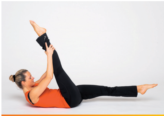
„Physical fitness is the first requisite of happiness.“ Joseph H. Pilates

Das Ziel dieser Ausbildung ist der Weg zu den klassischen Pilates Übungen, nicht das sofortige Beherrschen. Pilates Trainer sind Lehrer und Ihre Kunden sind Schüler. Als Lehrer sollten sie in der Lage sein, auch spektakuläre Pilates Übungen so zu vermitteln, dass Personen jeden Fitnesslevels nach ihren eigenen Fähigkeiten trainieren können. Ein guter Pilates Lehrer besitzt das nötige Know-How, um geeignete und sinnvolle Übungsvariationen für jeden Körper zu unterrichten.