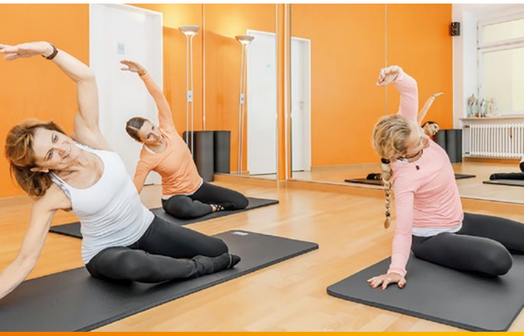
Persönlicher geht's nicht! Unsere Ausbildung findet in Kleingruppen ab 3 Teilnehmern statt.

Ein guter Pilates Unterricht setzt ein gewisses Maß an Übung voraus. Deshalb müssen zwischen den Modulen Unterrichts-, Hospitations- und Trainingsnachweise erbracht werden. Darüberhinaus sollten von Modul zu Modul die bereits durchgenommenen Ausbildungsinhalte in Theorie und Praxis gelernt werden, um einen problemlosen Anschluss an das Folgemodul zu finden.